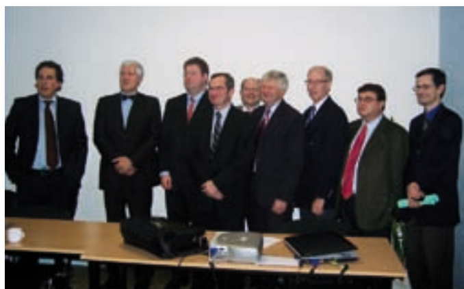
Les acteurs du lancement officiel du projet.

Vous le voyez, avec ces deux projets de centrales biomasse, avec la chaudière pilote au miscanthus de la SICA d'Epenancourt, avec la station INRA d'Estrées-Mons, ou encore avec le dynamisme du Pôle de Compétitivité Industrie et Agro-Ressources, l'Est de la Somme peut véritablement devenir un territoire d'excellence en matière d'énergies renouvelables d'origine végétale ! •